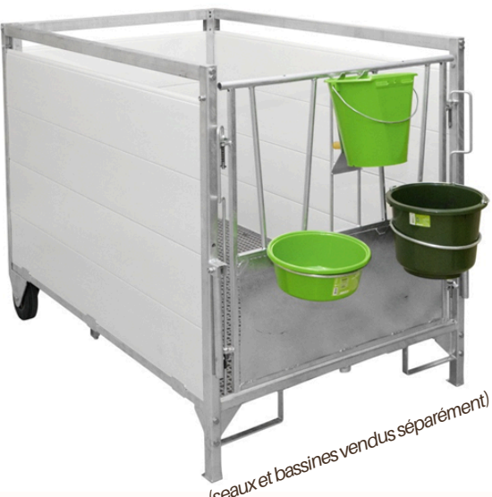
(seaux et bassines vendus séparément)